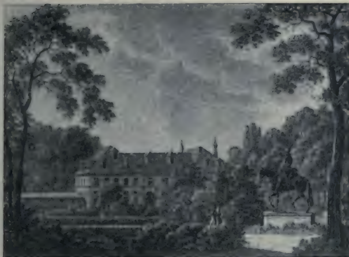
La Casa del Campo, près de Madrid.

Dessin de Bacler d'Albe. Lithographie de G. Engelmann. (Bibliothèque Nationale. Estampes.)